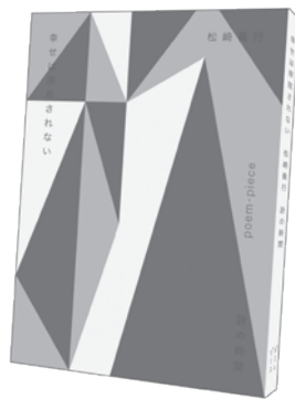
「幸せは搾取されない」 松崎義行 1300円 144 ページ